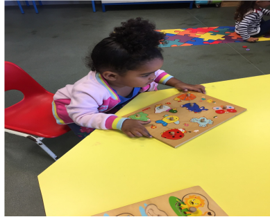
Stella celui des animaux