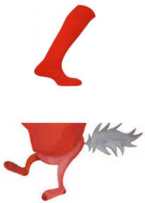
UN BAS ÉCARLATE