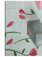
DES PÉTALES DE FLEURS