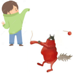
ENFILER LE PULL

Nous poursuivons l'exploitation de l'album du loup. Nous avons découvert du nouveau vocabulaire.