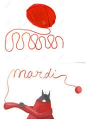
PELOTE DE LAINE