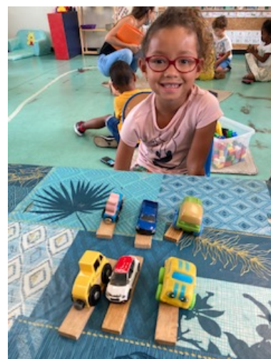
Les moyens jouent au jeu du garage. Ils doivent mettre autant de voiture qu'ils ont de place de parking (buchettes).