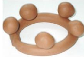
LA COURONNE DU ROI