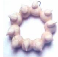
LA COURONNE DE LA REINE