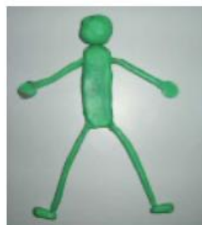
LE BONHOMME VERT