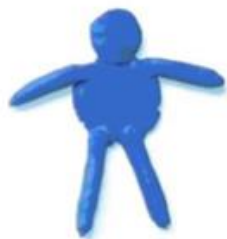
LE BONHOMME BLEU