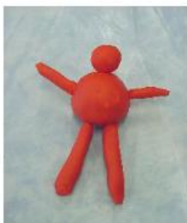
LE BONHOMME ROUGE