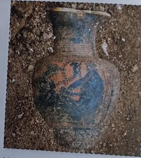
Vase à boire grec.