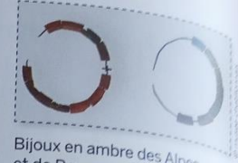
Bijoux en ambre des Alpes et de Bourgogne.