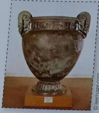
Vase de Sicile.