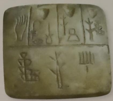
Pictogrammes (basse Mésopotamie, vers 3 300 avant J.-C.)