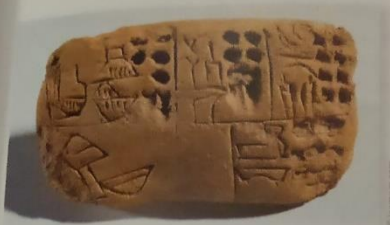
Tablette sumérienne : écriture cunéiforme.