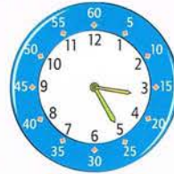
après-midi : 12 h + 3 h = 15 h, donc il est 15 h 25 min.

1 Écris les heures du matin et celles de l'après-midi.