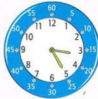
matin : 3 h 25 min

12 h, c'est midi : le milieu de la journée qui a commencé à 0 h (minuit). Sur le cadran de l'horloge, on lit l'heure par rapport à minuit (matin) ou midi (après-midi).