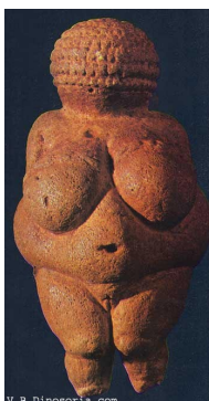
sculpture retrouvée en Autriche datant d'il y a 27000 ans.