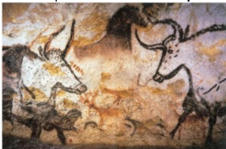
peinture de la grotte de Lascaux (Dordogne, France)

Homo Sapiens est le premier artiste de l'Humanité. Il peignait notamment des scènes de chasse sur les murs des cavernes. La grotte de Lascaux , en France, peinte il y a 17000 ans environ renferme près de 600 peintures. On a aussi découvert de petites statues de femmes qui prouvent qu'il savait aussi sculpter et graver .