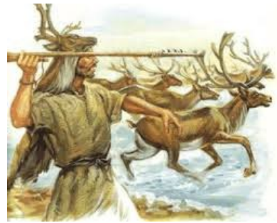
dessin représentant un Homme de Cro-Magnon chassant avec un propulseur