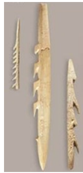
harpons en os

Homo Sapiens a appris à fabriquer d'autres outils qui lui permettaient de mieux chasser. Le javelot , l' arc et le propulseur lui permettaient de chasser les mammoths, les bisons, les sangliers en évitant de s'approcher trop près. Pour pêcher, il a sculpté des harpons en os .