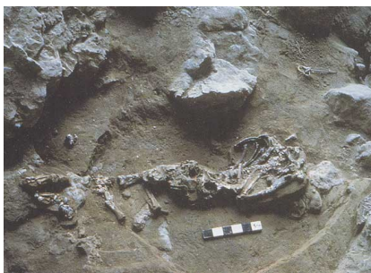
tombe découverte à Shanidar en Irak

Contrairement à l'Homo Habilis et l'Homo Erectus, l'Homo Néandertalis n'abandonnait pas ses morts. Il est le premier à les enterrer ou les brûler . Cela prouve qu'il était assez évolué pour ne pas penser uniquement à se protéger et à se nourrir.