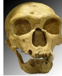
crâne fossilisé d'un Homo Néandertalis

Homo Néandertalis , ou Homme de Néandertal, est apparu il y a 300 000 ans et a disparu brutalement il y a 30 000 ans . Il a vécu en Europe , au nord de l' Afrique et en Asie . Son nom vient de la vallée de Néandertal, en Allemagne, où a été découvert le premier squelette d'Homo Néandertalis. Pendant une période, il a vécu en même temps que l'Homo Sapiens.