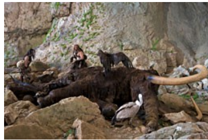
reconstitution du dépeçage d'un mammouth

Homo Néandertalis connaissait le feu et savait faire cuire les aliments. À cette époque, il s'agissait surtout de viande de mammouth et de rhinocéros laineux et de plantes cueillies . L'Homme de Néandertal a aussi fabriqué des outils pour travailler le bois et les peaux. Il construisait des abris en bois et des vêtements en peau et en fourrure .