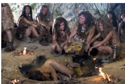
reconstitution d'une mise en terre