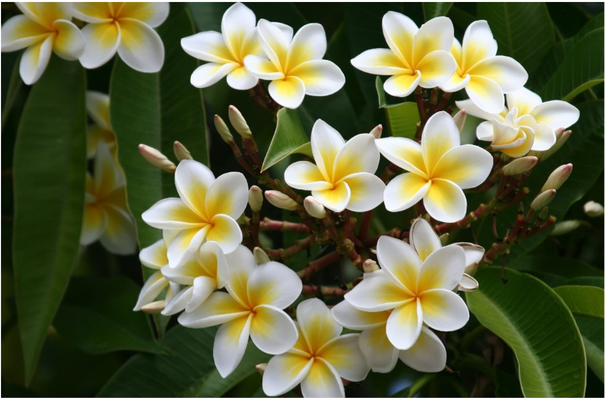
Fleurs du frangipanier