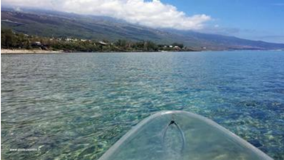
Les activités nautiques