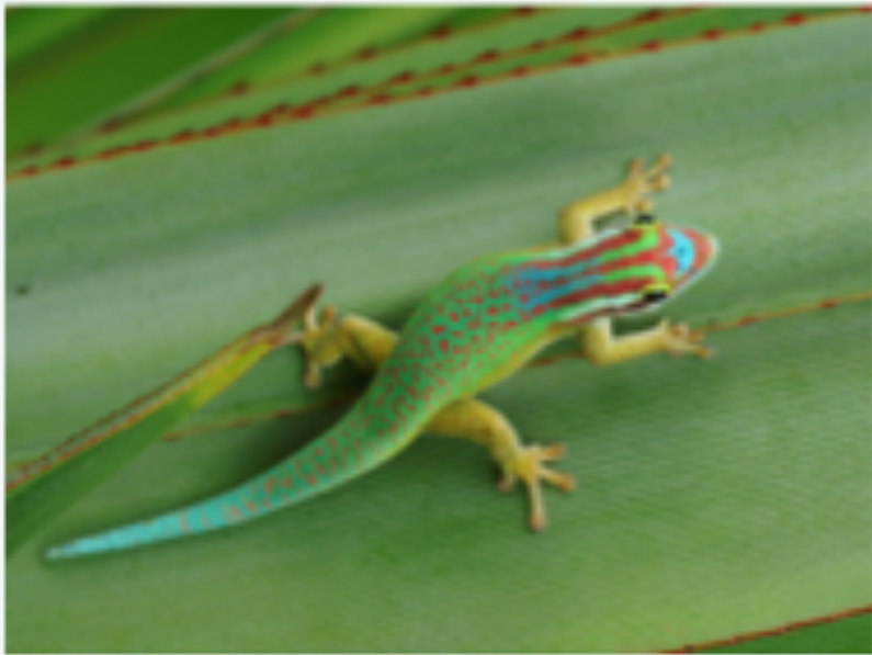
Lézard de la Réunion