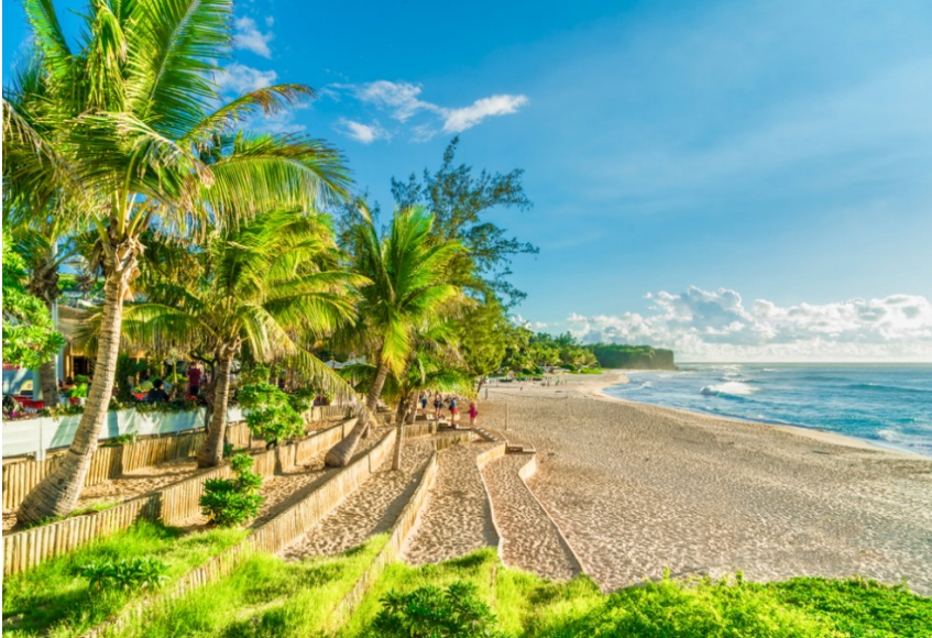
La plage de Boucan Canot