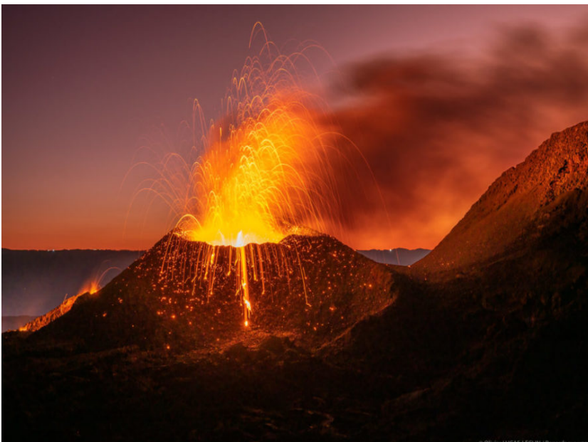
Le Piton de la Fournaise