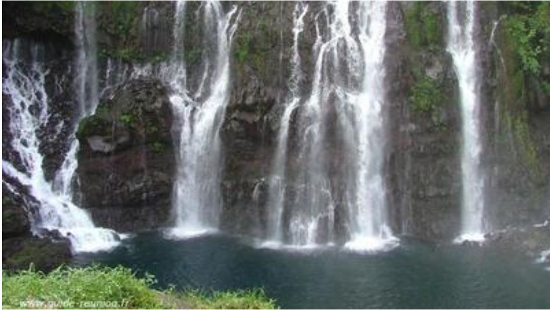
La cascade Langevin