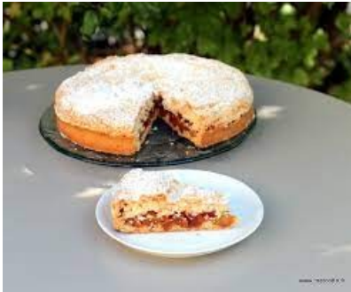
-Le nougat de Tours