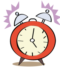
un ré veil

une fille une bille une coquille une béquille la vanille la famille un billet le grillage