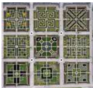
Les jardins de Villandry