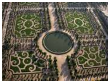
Les jardins du château de Versailles