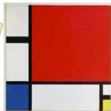
Composition II en rouge, bleu et jaune 1930

L'art abstrait est un art qui ne représente pas la réalité.