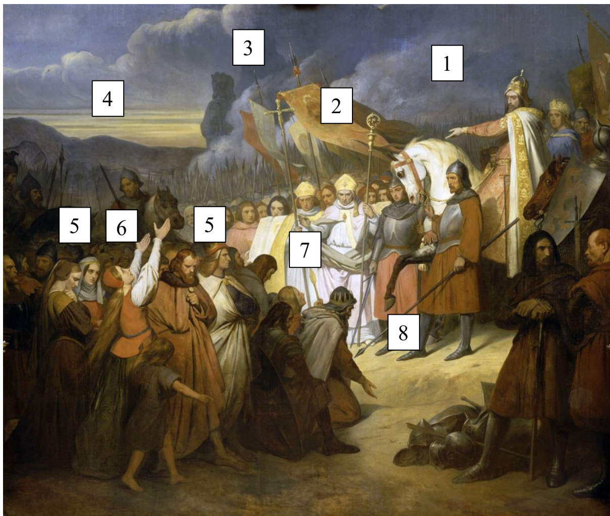
Les saxons se soumettent à l'empereur Charlemagne en 785 à Paderborn. Tableau peint par Ary Scheffer en 1837 exposé dans la galerie des batailles du château de Versailles