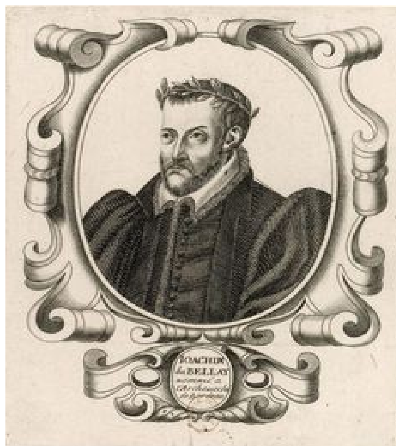
Le poète Joachim du Bellay