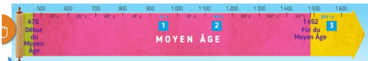
Doc. 2 Quelques repères du Moyen Âge