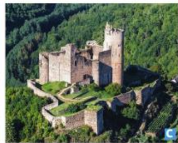
Doc. 1 Trois types de châteaux