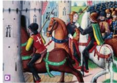
Doc. 1 Quatre moments de la vie de Jeanne d'Arc. Enluminures, vers 1484.

1 Lis les textes du document 2, puis fais correspondre les extraits de texte avec les bonnes images du document 1, qui ont été mélangées.