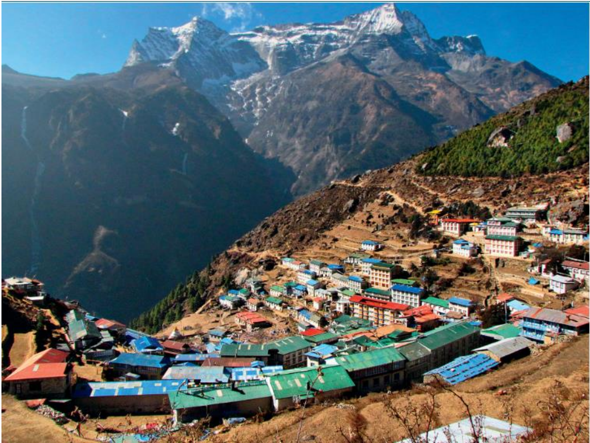
Doc. 1 Le village de Namche Bazar au Népal, dans l'Himalaya (altitude : 3 440 mètres)

Ecris Recherche 1 : Quelles sont les points communs et les différences entre le paysage de l'histoire « un matin d'hiver » et la photographie ?