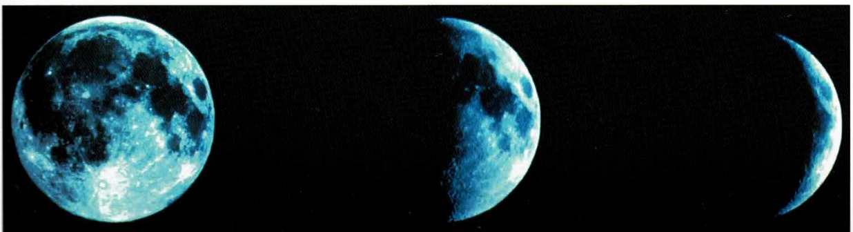
un croissant de lune