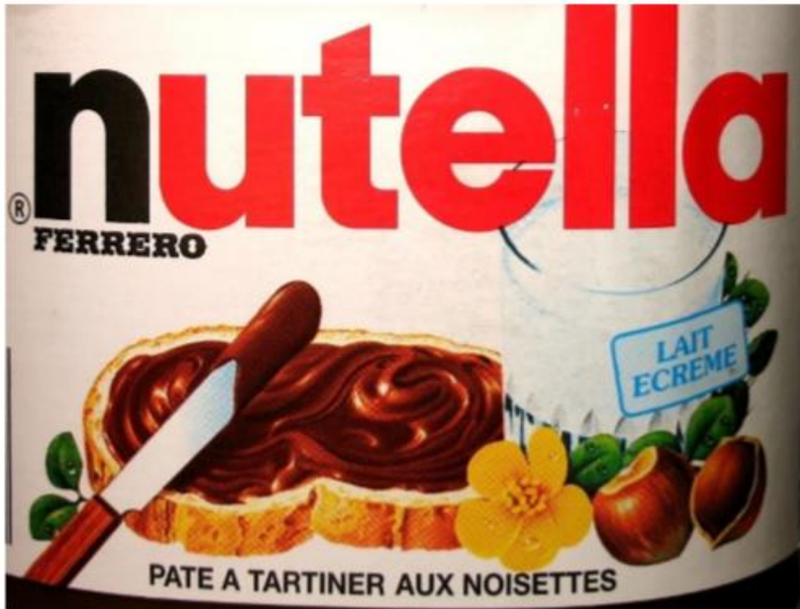
Document 1 : Etiquette d'un pot de nutella

INGREDIENTS : SUCRE, HUILE VEGETALE, NOISETTES (13%), CACAO MAIGRE (7,4%), LAIT ECREME EN POUDRE (6,6%), LACTOSERUM EN POUDRE, EMULSIFIANT (LECITHINE DE SOJA), AROME.