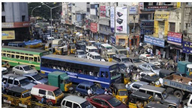
Doc. 1 : Scène d'embouteillage à Mumbai

1. Où se situe la ville de Mumbai en Inde ?