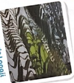
Rizières de Longji