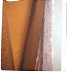
Désert de Taklamakan