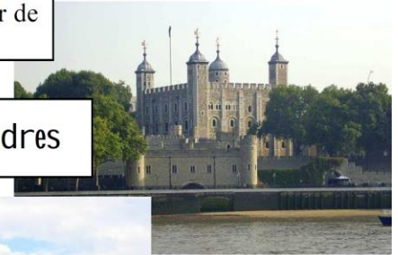
Tour de Londres