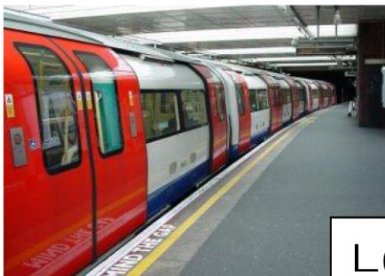
Le tube : métro londonien