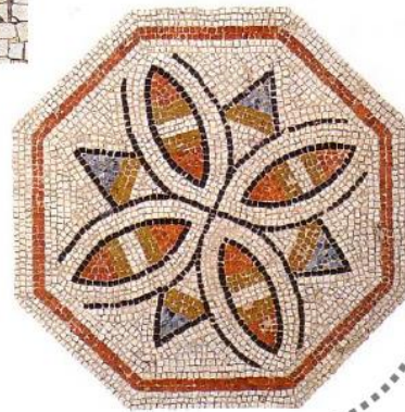
Détail de la mosaïque aux Fleurons , III e siècle après J.-C. musée gallo-romain de Saint-Romain-en-Gal.