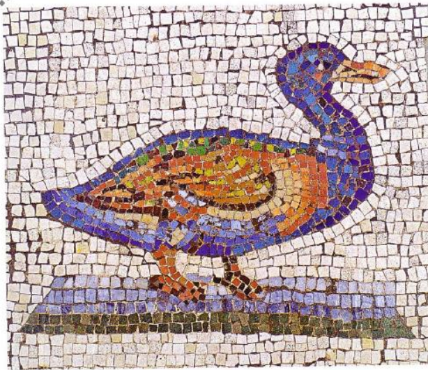
Détail de la mosaïque d' Orphée charmant les animaux , fin du II e siècle après J.-C., musée gallo-romain de Saint-Romain-en-Gal.

La mosaïque est un art décoratif où l'on utilise des fragments de pierre, d'émail, de verre ou encore de céramique, assemblés à l'aide de mastic ou d'enduit, pour former des motifs ou des figures. Quel que soit le matériau utilisé, ces fragments sont appelés des tesselles . Elle est très utilisée pendant l'antiquité romaine.