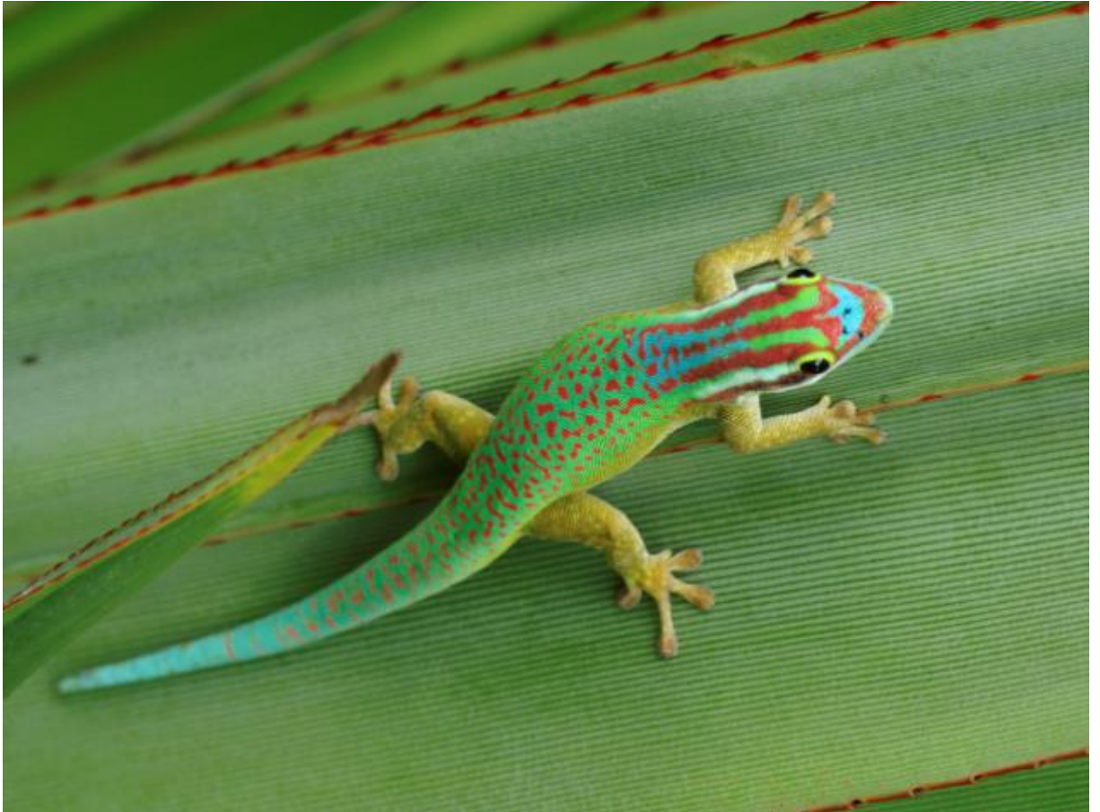
Lézard de la Réunion