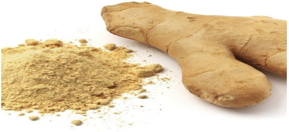
Gingembre frais et en poudre