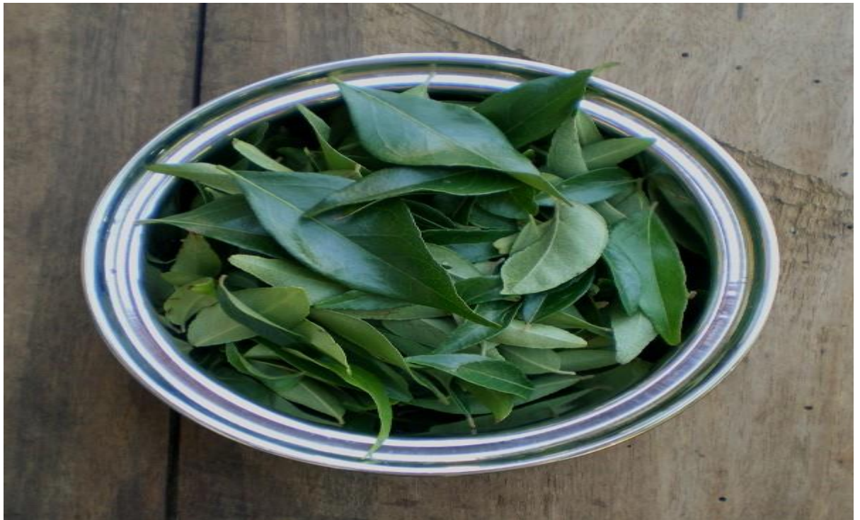
Feuilles de calou pilé