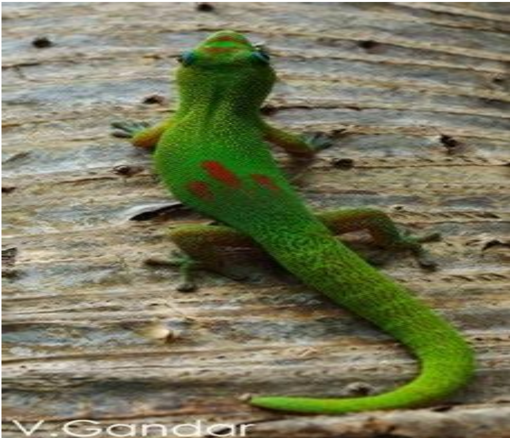
Gecko de Madagascar