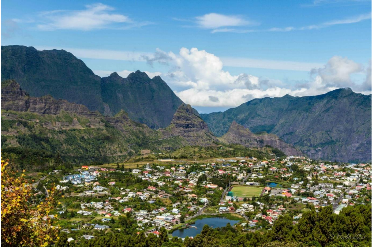
Cirque de Cilaos