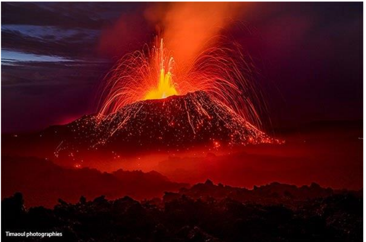
Piton de la Fournaise en éruption