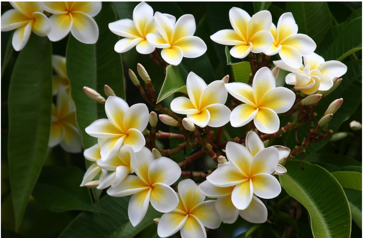
Fleurs du frangipanier