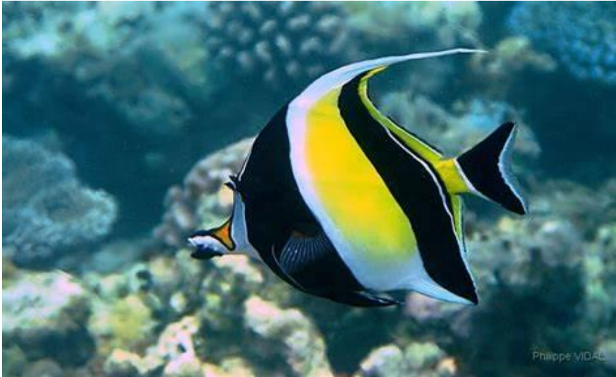
Poisson cocher masqué