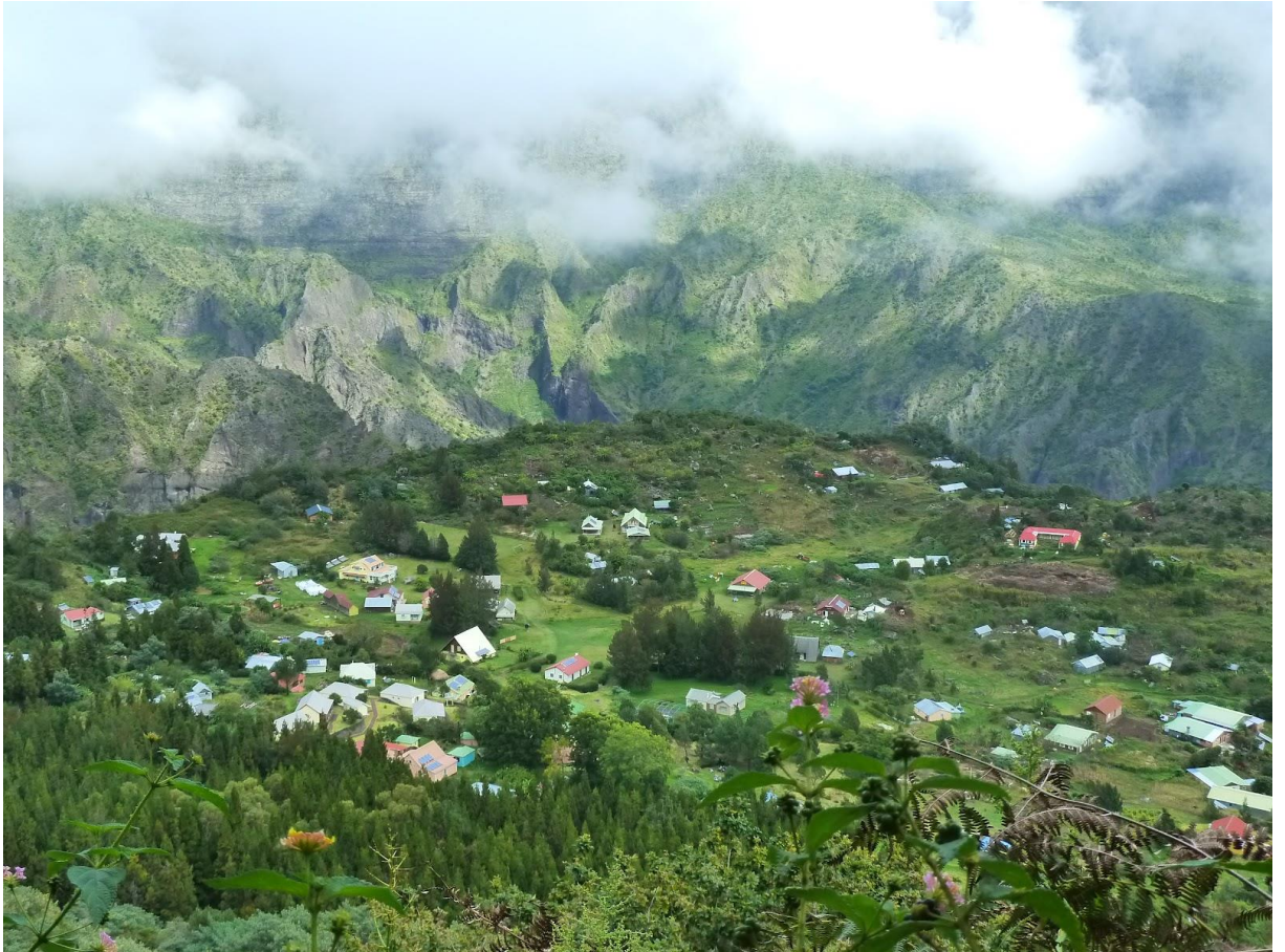
Cirque de Mafate