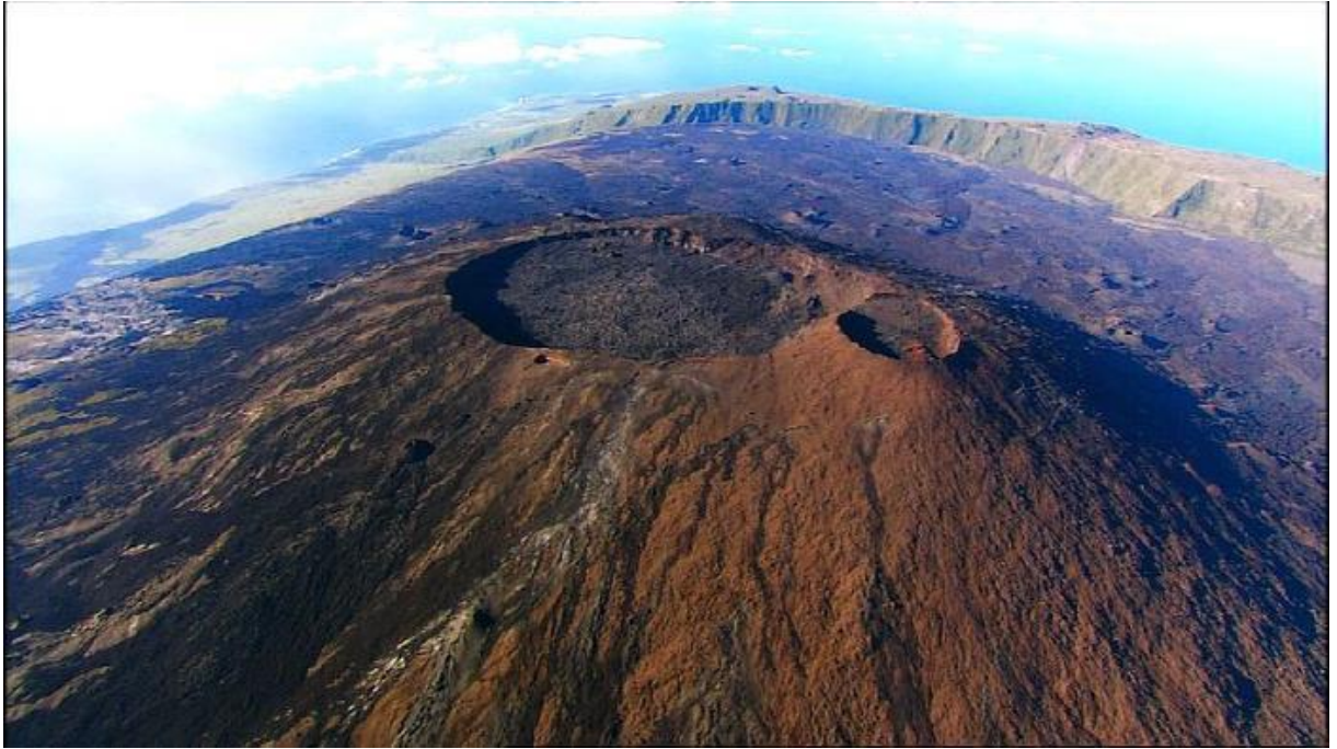
Piton de la Fournaise