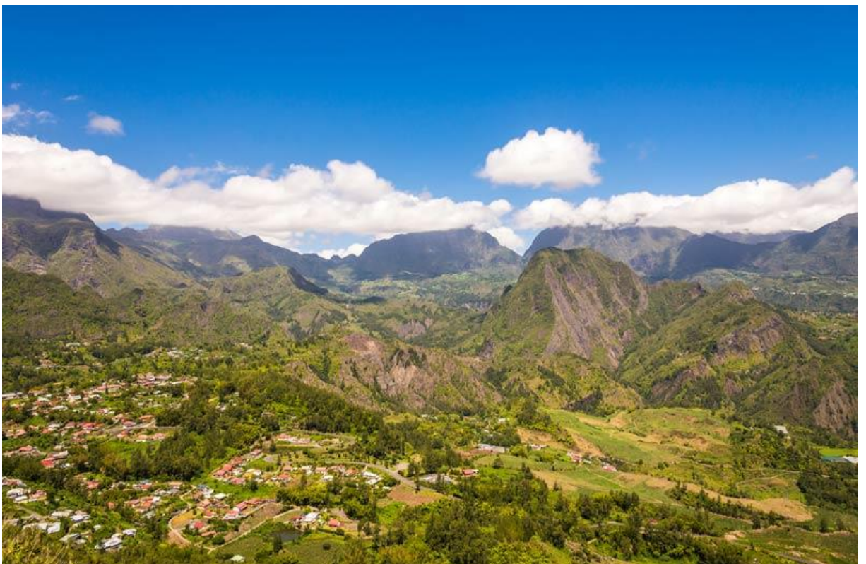
Cirque de Salazie