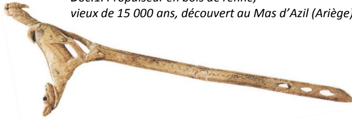
Doc.1. Propulseur en bois de renne, vieux de 15 000 ans, découvert au Mas d'Azil (Ariège)

Les archéologues ont étudié cet objet et ont cherché à quoi il pouvait servir. Ils pensent qu'il s'agit d'un propulseur qui permettait de lancer des flèches.