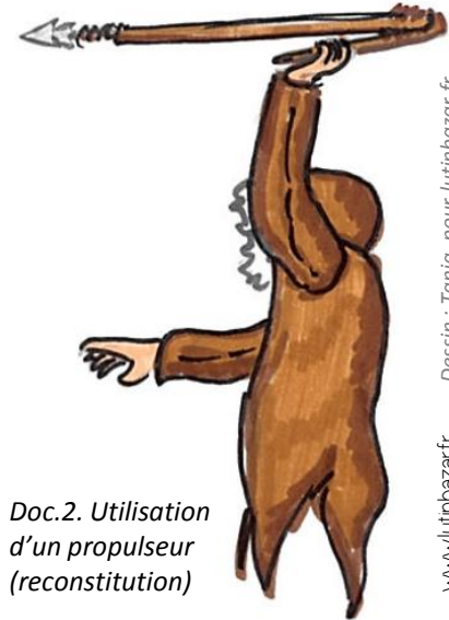
Doc.2. Utilisation d'un propulseur (reconstitution)

Cela nous apprend qu'ils chassaient pour se nourrir.