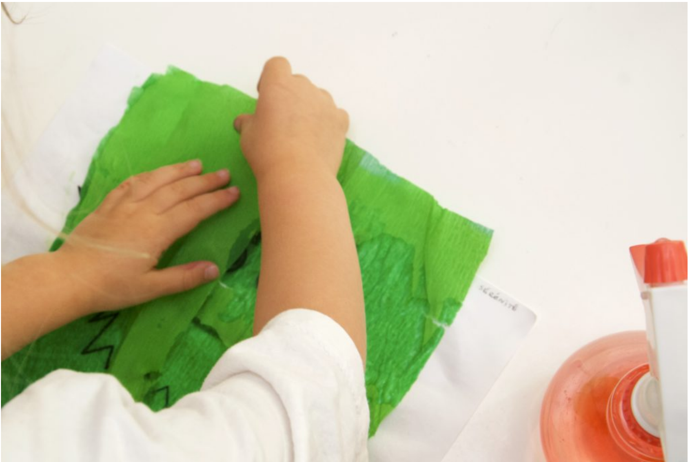
4 – Enlever le papier crépon.