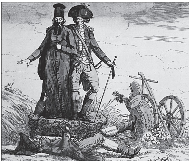
Doc. 1 Le tiers état écrasé par le clergé et la noblesse, caricature, 1789.