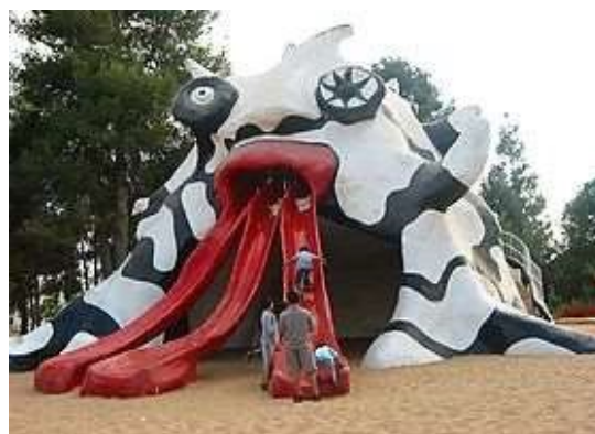
Le Golem - Israel