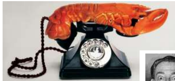
Le Téléphone Homard est une œuvre de Salvador Dalí créée en 1936

Ils vont se donner le nom de surréalistes . Ils vont laisser aller leur imagination sans aucune retenue et vont créer un monde qui va te paraître un peu bizarre. Les objets deviennent les supports d'un univers imaginaire.