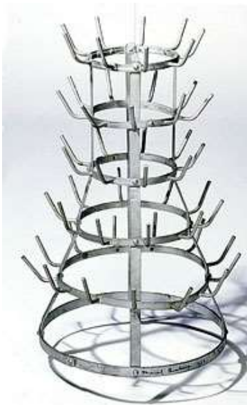
Porte-bouteilles 1914 (1964) (Séchoir à bouteilles ou Hérisson) Porte-bouteilles en fer galvanisé Marcel Duchamp

« TOUTE DECOUVERTE CHANGEANT LA NATURE, LA DESTINATION, D'UN OBJET OU D'UN PHENOMENE CONSTITUE UN FAIT SURREALISTE. » - 1924- André Breton