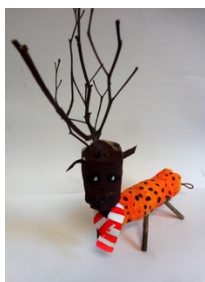
Exemple en image