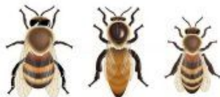
Le faux-bourdon La reine L'ouvrière