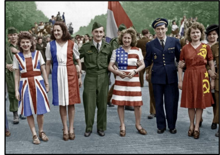
La joie et la fête après la signature de l'armistice à Paris.

Le 8 mai est un jour férié en France. À cette occasion, les écoles sont fermées et la majorité des gens ne travaillent pas.