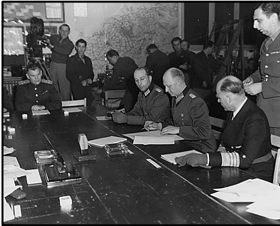
L'armistice signé le 8 mai 1945.

L'armistice du 8 mai 1945 : Le 8 mai 1945 est une date historique importante ; ce fût la fin de la Seconde Guerre mondiale en Europe. Ce jour – là, l'Allemagne capitule et les Alliés remportent la victoire sur l'Allemagne nazie.