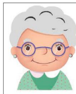
Esperanza es mi abuela.